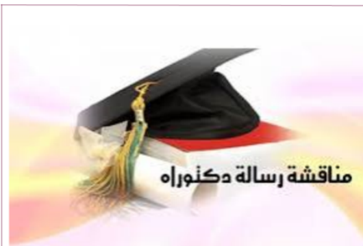
مناقشة رسالة دكتوراه

و بهذا تكون جامعة سكيكدة قد استطاعت التوسع في خريطة التكوين بفتح تخصصات جديدة طيلة هذه السنوات و تكوين المؤطرين البيداغوجيين المناسبين لهذه التخصصات بفضل نظرتها الاستشرافية في فتح التكوين في الدكتوراه.